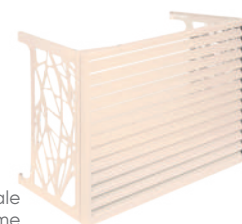
Gamme Initiale couleur crème