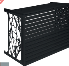
Gamme Confort couleur gris anthracite