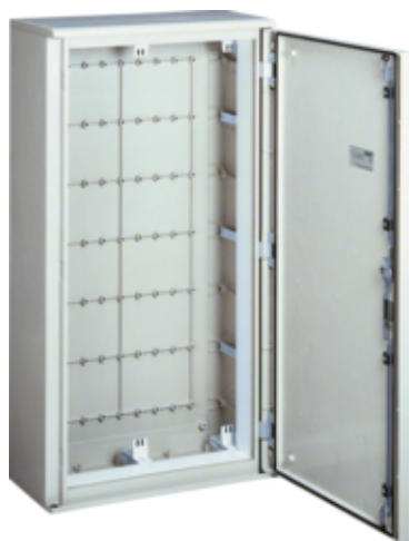
Arm.univers 600x1150x300 IP65 cl.II