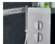
Douchette à main