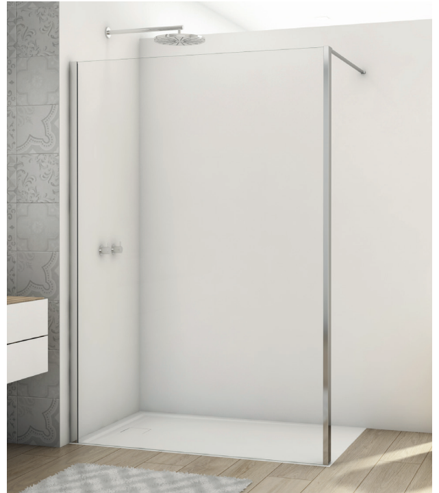
↑ DIVERA Walk-in D22BTK1H (Finition Poli-brillant)