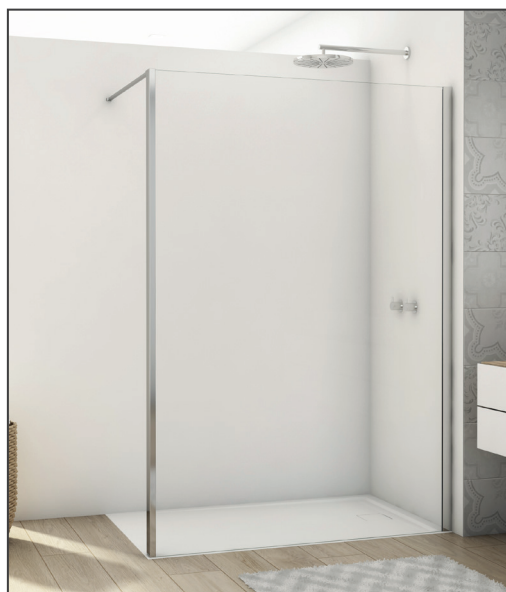
↑ Finition Poli-Brillant