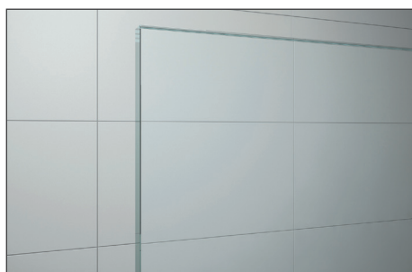
↑ Vitrage Transparent (07)