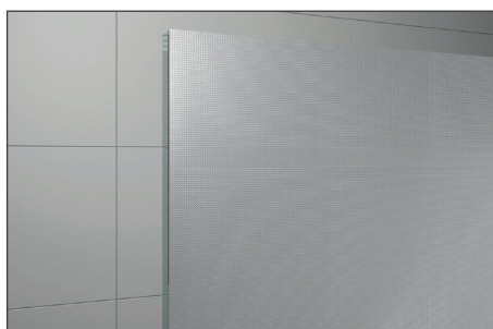
↑ Vitrage Screen (87)