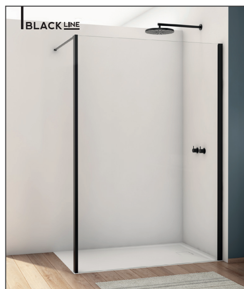
↑ Finition Noir mat