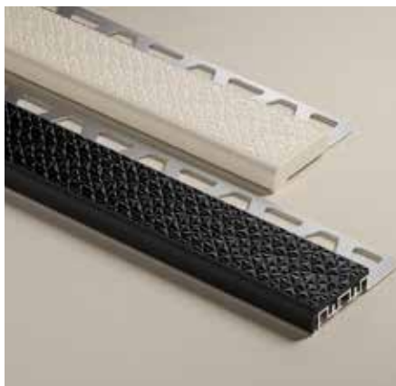
Association des coloris GS et SP (TREP-V 42/12)